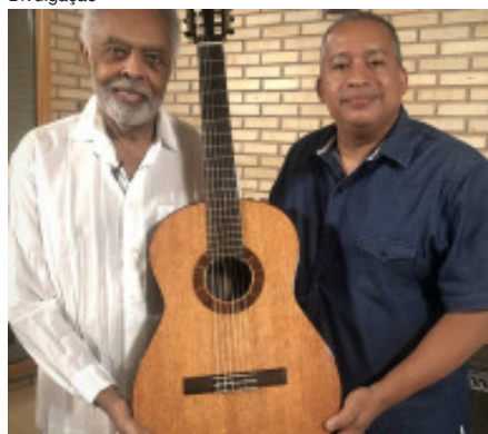
Gilberto Gil com Davi Lopes e o violão feito com madeiras remanescentes do incêndio do Museu Nacional

história, que não podia ser desperdiçado. Elaborou, então, a proposta de produzir instrumentos musicais com aquela madeira e pediu autorização para utilizá-la, pois, ainda que se tratasse de escombros, continuava sendo patrimônio da União. A ideia do documentário nasceu logo na primeira reunião, e as filmagens foram iniciadas mesmo sem patrocínio firmado. As madeiras - pinho de riga, mogno, cedro, vinhático, peroba-do-campo, braúna, jacarandá - foram retiradas, selecionadas e catalogadas. Fernanda Guedes, coordenadora de comunicação do Museu Nacional, viabilizou o projeto do documentário, que contou com a participação dos jornalistas Vinícius Dônola e Roberta Salomone, autores do roteiro e responsáveis pela direção do filme, ao lado de João Rocha.