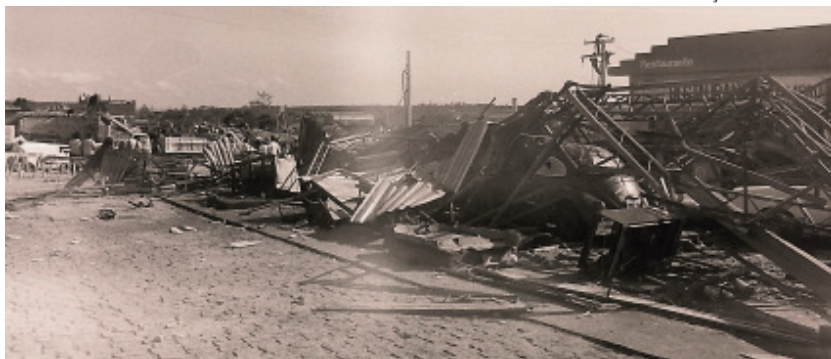
Destroços de posto de combustíveis e funilaria de caminhões na Avenida Tiradentes, em frente ao Hotel San Raphael

Arrebentando tudo o que encontrava pela frente, o tornado seguiu por trás do Bairro Rancho Grande, atingindo várias propriedades rurais nas imediações da Estrada do Pinheirinho. A Cerâmica Nossa Senhora da