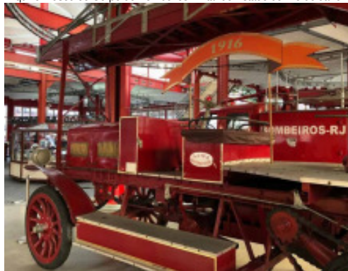
Veículo de 1916 do Corpo de Bombeiros do Rio de Janeiro

tor do Corpo de Bombeiros da Corte, as tarefas de organizar e comandar a Seção. “Foi ela o início, ou