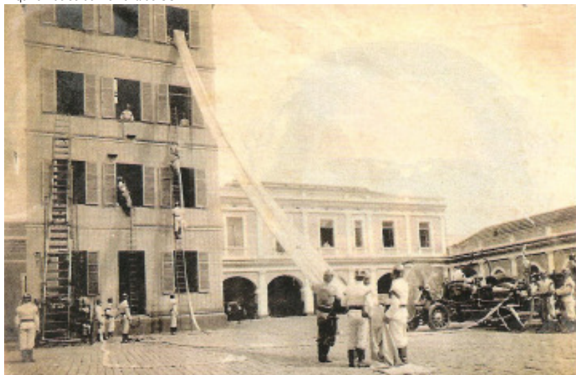
Bombeiros de São Paulo em treinamento no início do século 20

um Corpo de Bombeiros. “É admirável, Sr. Presidente, vergonhoso mesmo, permita-me a franqueza, que em uma cidade tão importante como São Paulo/SP, tão rica quanto populosa, não exista um Corpo de Bombeiros perfeitamente organizado.” O projeto que ele então apresentou, aprovado em 27 do mesmo mês, autorizou o governo provincial a criar uma seção de bombeiros anexa à Companhia de Urbanos (que, na década de 1920, seria chamada de Guarda Civil) da capital e a adquirir os maquinismos próprios à extinção de incêndios.