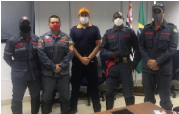
Com apoio da Defesa Civil, Grupo de Bombeiros Civis Voluntários foi formado neste ano em Itu

tramitar na Câmara Municipal de Vereadores um projeto de lei oficializando o grupo.