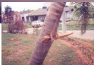
Tornado provocou destelhamento de casas e outros estragos no Condomínio Terras de São José; no detalhe, nessa mesma região, uma viga de madeira atravessou o troco de uma palmeira com a força do vento