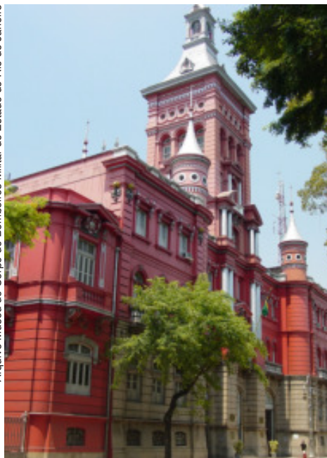
Edifício histórico do Corpo de Bombeiros Militar do Estado do Rio de Janeiro – CBMERJ