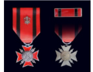
Medalha do Centenário do Corpo de Bombeiros de SP