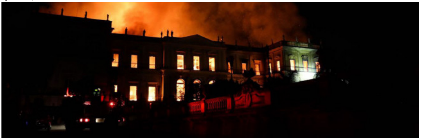
Museu Nacional em chamas