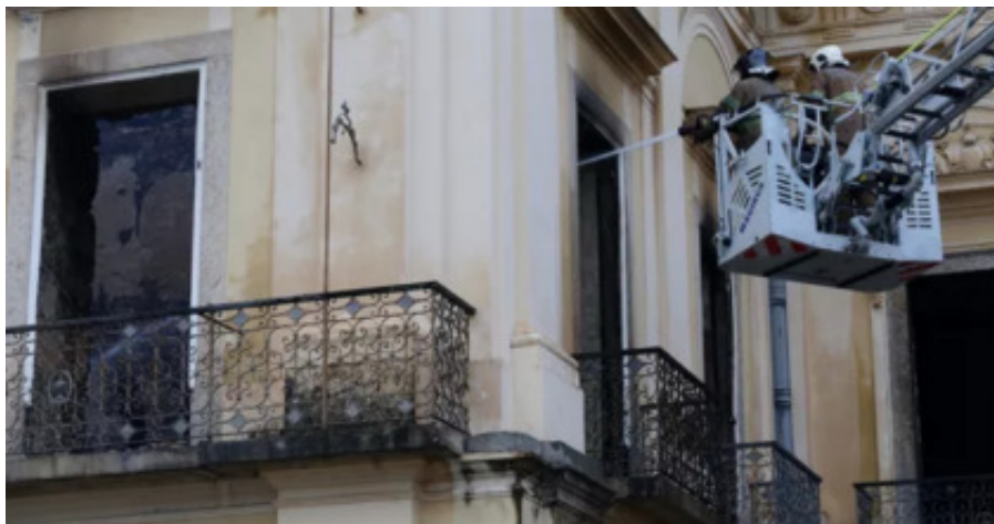
Bombeiros em ação no Museu Nacional