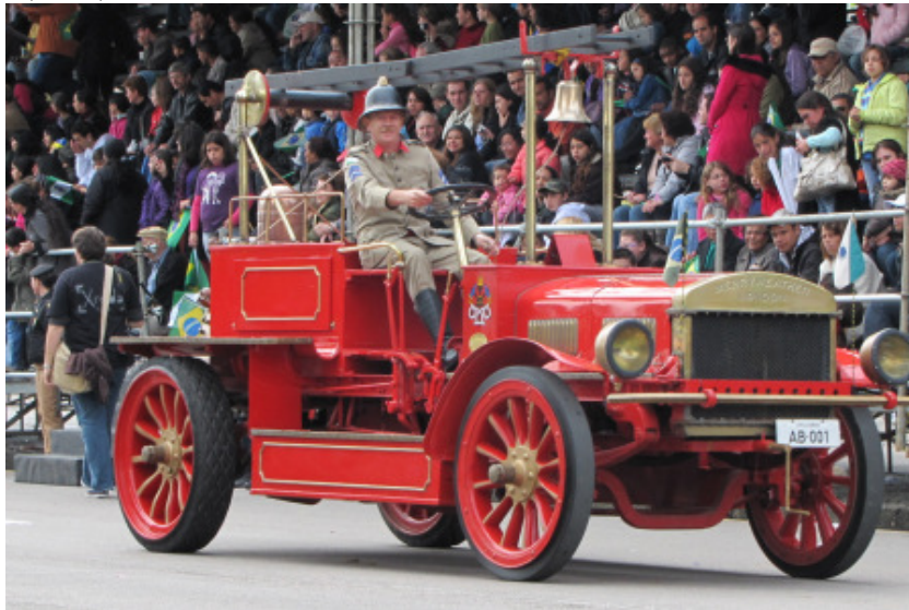
Viatura Merryweather do Corpo de Bombeiros do Paraná

melhor, o primeiro núcleo de homens instruídos no serviço de extinção de incêndio e ao redor do qual se reuniram pouco a pouco outros elementos, vindo a constituir a magnífica corporação de bombeiros que hoje possuem os paulistas e que, sem exagero, podemos afirmar, é pelo menos igual à melhor corporação congênere do Brasil”, escreveu o major Pedro Dias de Campos, autor de “O Corpo de Bombeiros de S. Paulo”, publicado em 1911 na Revista do Instituto Histórico e Geográfico de São Paulo (volume XIII – 1908).