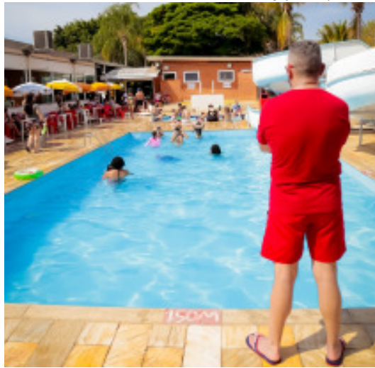
Parque Maeda conta com a atuação de bombeiros civis para prevenir acidentes em suas piscinas e tobogãs

Em Itu, os prédios públicos municipais com obrigatoriedade técnica para brigada de incêndio são: Grupo Melhor Idade, Secretaria de Turismo, Secretaria de Segurança e o Paço Municipal. Os brigadistas de todas as unidades citadas são servidores públicos e atuam nas brigadas como voluntários. A orientação é realizada pela Defesa Civil e o treinamento é concedido pelo Corpo de Bombeiros. No Paço Municipal, há dois brigadistas em cada andar. Nos hospitais (Santa Casa e Municipal), as brigadas também são formadas por funcionários voluntários.