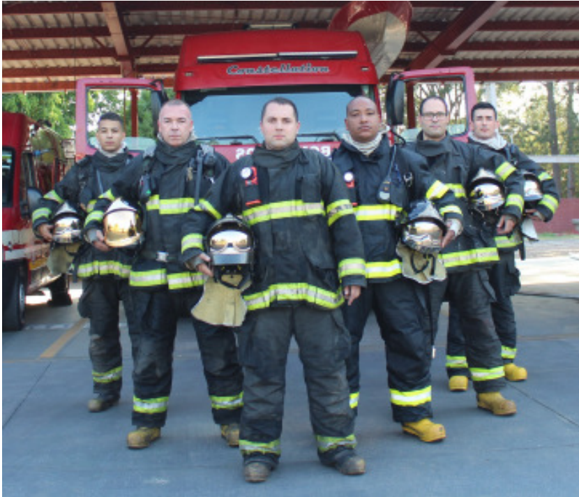
Soldados do Corpo de Bombeiros que formam a prontidão azul na Estação de Bombeiros de Itu

pastos ou áreas verdes. No verão, os afogamentos são constantes”, explicou.