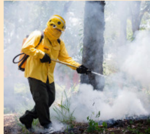
Bomba costal da Guarany é usada no combate a incêndios no campo