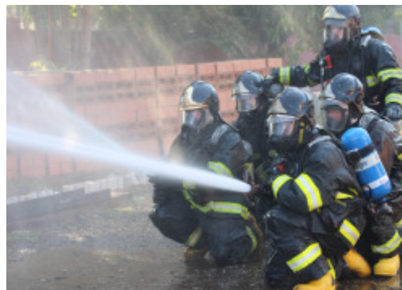
Treinamentos são frequentes no Corpo de Bombeiros de Itu