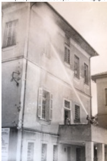
O incêndio na Codeisa destruiu boa parte do imóvel e uma grande quantidade de documentos

Denominado Espaço Teotônio Vilela, o prédio localizado na Rua do Patrocínio em frente ao prédio CEUNSP (Centro Nossa Senhora do Patrocínio), per-