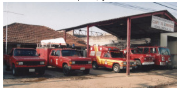
Quartel do Corpo de Bombeiros na Avenida Francisco Ernesto Fávero, o local mais alto da cidade