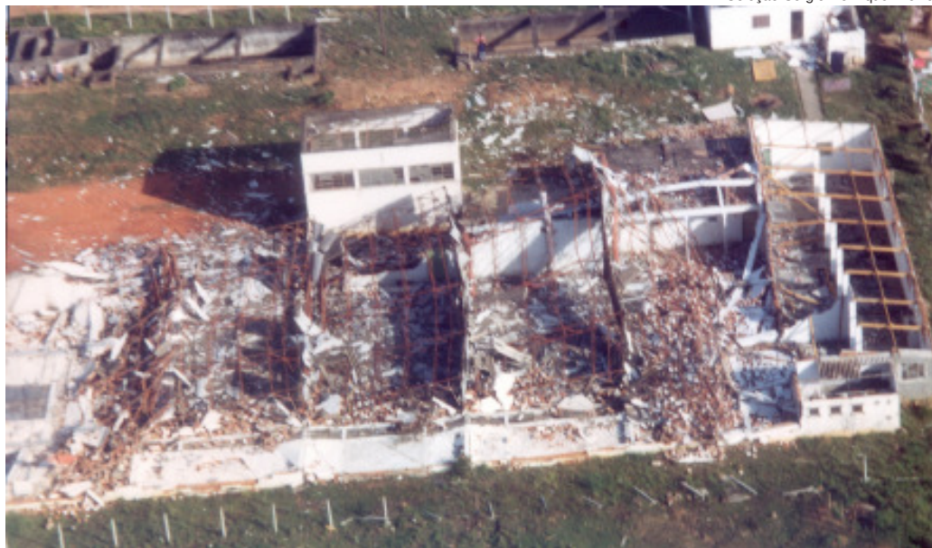
Imagem feita no helicóptero na manhã seguinte à tragédia mostra o rastro de destruição do fenômeno na zona rural de Itu. Tornado destruiu dezenas de empresas e milhares de casas em seu trajeto

A tragédia teve repercussão na imprensa nacional com números assustadores: 16 mortes, mais de 200 feridos, destruição total ou parcial de 765 casas e 29 indústrias, além de 2,5 mil desabrigados. A catástrofe