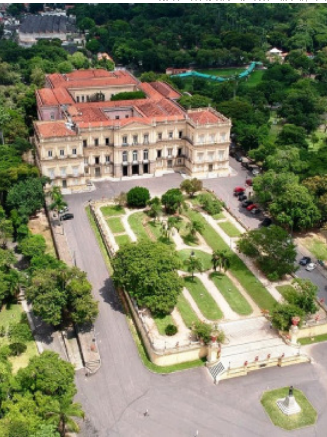
Museu Nacional e seu entorno