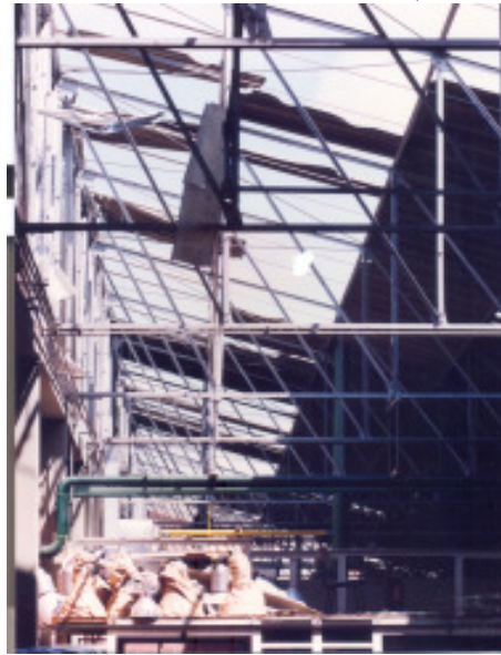
Muitas indústrias na rota do vendaval tiveram parte de suas instalações destruídas como mostra esta foto de como ficou o telhado da Starret

A rota de destruição também atingiu o Jardim São Judas Tadeu, devastando várias casas, comércios, um posto policial e parte de uma escola. Na sequência, o percurso do tornado saiu da zona urbana, atingindo novas propriedades rurais nas imediações da Estrada do Pau D’Alho e seguiu em direção ao vizinho município de Cabreúva/SP.