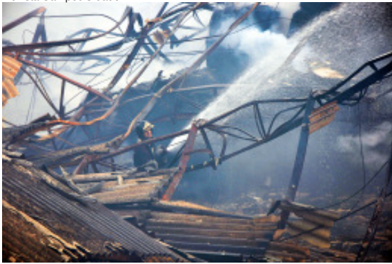
Bombeiro combate fogo entre as ferragens retorcidas do galpão da Apollo Spuma em 2011. No detalhe, policiais observam as chamas do incêndio na fábrica