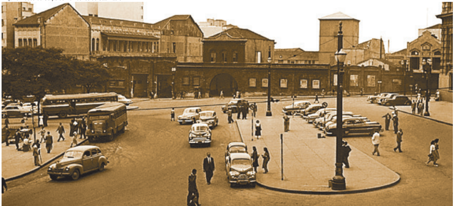
Fachada do quartel central do Corpo de Bombeiros de São Paulo, na Praça Clóvis Beviláqua, em 1953