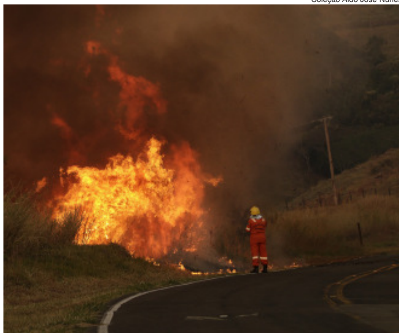
Incêndios em propriedades rurais em Itu, principalmente em períodos de estiagem, incentivaram a implantação de brigadas