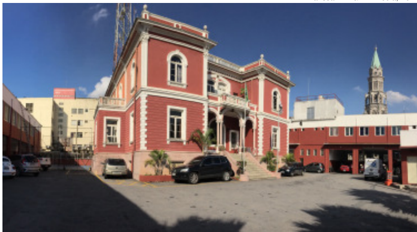
Edifício do Centro de Memória do Corpo de Bombeiros de Campinas

Atualmente, é no dia 2 de julho, data de criação do Corpo de Bombeiros da Corte, que se comemora o Dia do Bombeiro, que hoje não só combate incêndios, mas se responsabiliza por atividades de busca e defesa civil e pelos atendimentos pré-hospitalares, em caso de trauma, salvamentos terrestres, marítimos e em altura.