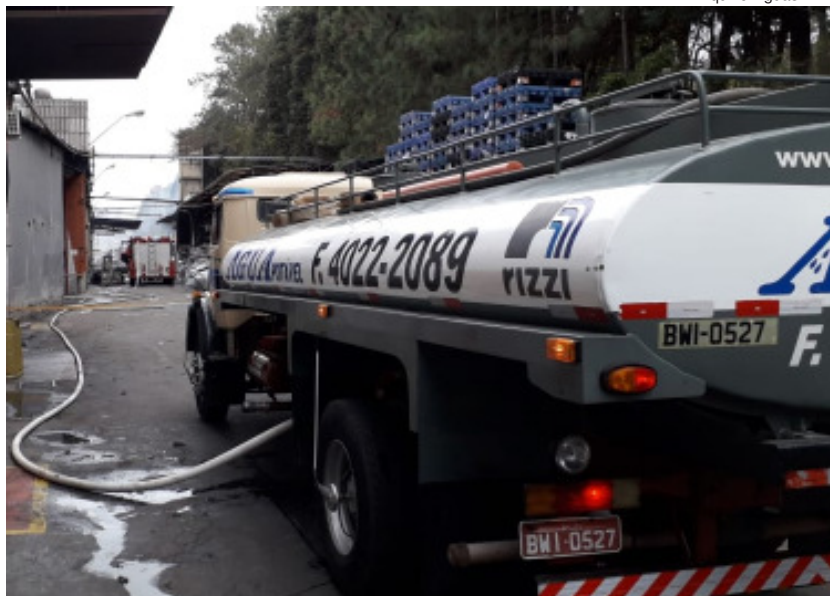
A Águas Rizzi deu suporte também no incêndio ocorrido na COPLAC, em 2018