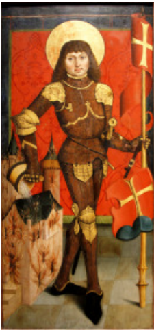
São Floriano, padroeiro dos bombeiros