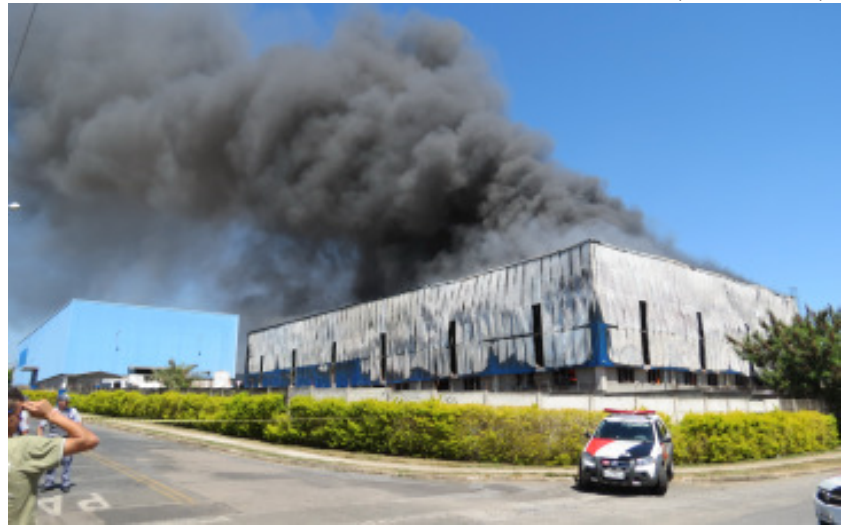
Incêndio na IBBL em 2013, um dos maiores da história da cidade nos últimos tempos

avistar a fumaça escura desse incêndio a quilômetros da Avenida Caetano Ruggieri.