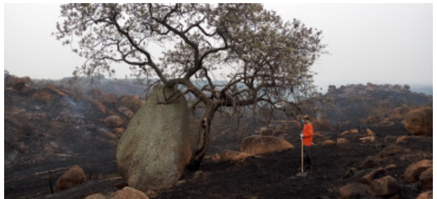
Bairro Pedregulho concentra propriedades rurais, alvos constantes de incêndios