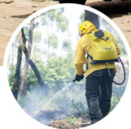
Mochila Flexível Plus