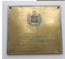
Casa construída entre os anos de 1840 e 1850 no lugar da antiga Câmara Municipal, incendiada em 1848. No detalhe, placa comemorativa ao título outorgado por Dom Pedro I: A Fidelíssima